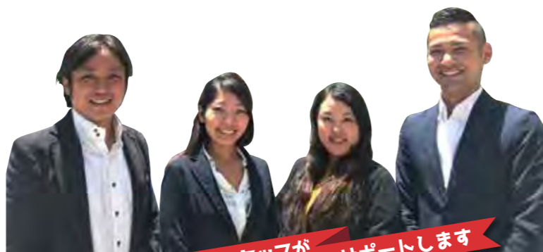
日本人スタッフがサポートします

キャンプ期間中は日本人スタッフもバックアップしていますので、初めての海外、初めて親元を離れる、という生徒さんでも安心してご参加いただけます。学習面だけではなく、生活面やホームシック、参加者間の良い人間関係の構築にも気を配りながらサポートいたします。また、キャンプ期間中はブログにて写真をアップしますので、保護者の皆様にも日本からお子様の様子をご確認いただくことができます。